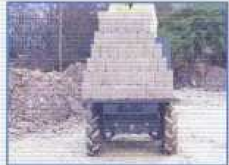
NÁKLADOVÁ PLOŠINA pro škvárobetonové bloky a pytle s cementem