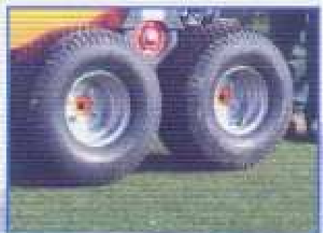
FLOTAČNÍ PNEUMATIKY - Pro měkké podlaží