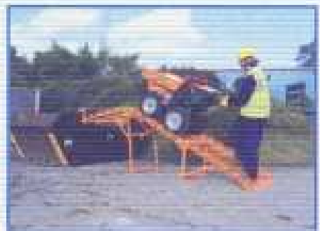
RAMPA - skládací a snadno transportovatelná