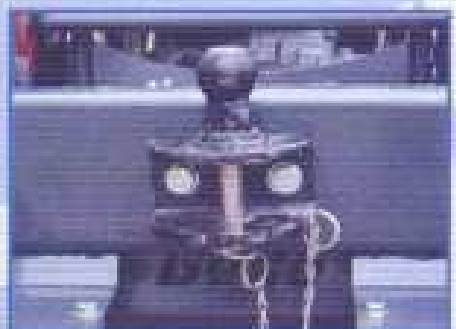
VIDITELNÉ TAŽNÉ ZAŘÍZENÍ - Těžký přívěs